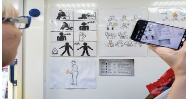
Ein Blick ins Krankenmobil der Caritas Hamburg. Zu sehen sind Erklär-/Zeigetafeln für beispielsweise Menschen, die sich nicht oder nur schwer mit Sprache verständigen können

Alle Gefahren, Risiken und Probleme, mit denen wohnungs- und obdachlose Menschen zu kämpfen haben, treffen erschwert auch auf Menschen mit Behinderungen zu. Bislang fehlt es jedoch an einer systematischen wissenschaftlichen Analyse des Themas Wohnungslosigkeit und Behinderung . Hier zeigt sich eine Forschungslücke, die dringend geschlossen werden muss. Denn nur auf der Grundlage empirischer Daten lassen sich pass-