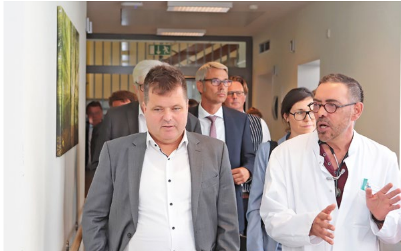
Jürgen Dusel zu Gast im Krankenhaus Mara in Bielefeld

tungsorganisationen von Menschen mit Behinderungen erarbeitet werden.