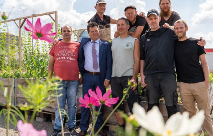
Gruppenbild bei der Gemüsewerft Bremen – einem Zuverdienstbetrieb

In den letzten 22 Jahren stieg der Anteil von Menschen, die aufgrund von seelischer/psychischer Erkrankung frühzeitig in Rente gingen , von 18,6 auf 43 Prozent. Ihr Leistungsvermögen liegt unterhalb von drei Stunden Arbeit täglich. Das bedeutet jedoch nicht, dass Menschen mit einer psychischen Beeinträchtigung oder Suchterkrankung nicht arbeiten können und wollen. Zur Stabilisierung und sozialen Teilhabe benötigen sie jedoch in besonderer Weise Angebote, die auf eine berufliche Eingliederung hinführen . Diese müssen niedrigschwellig und am individuellen Bedarf ausgerichtet sein und tagesstrukturierend wirken. Werkstätten für behinderte Menschen (WfbM) können diesen Rahmen häufig nicht bieten.