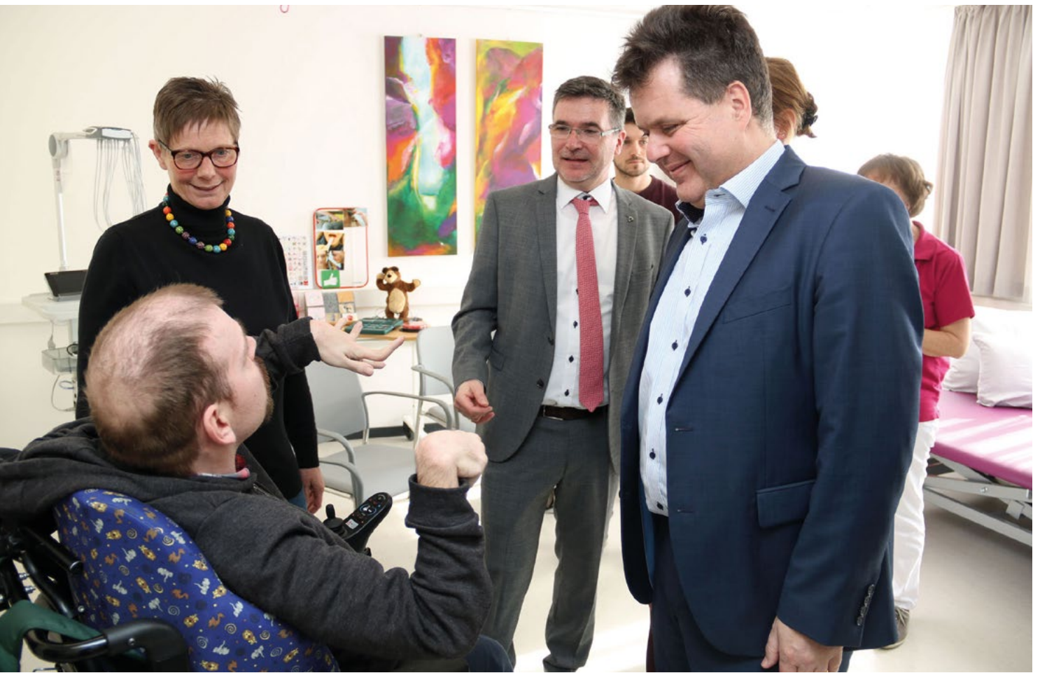
Jürgen Dusel zu Gast im Medizinischen Behandlungszentrum für erwachsene Menschen mit komplexer Behinderung in Würzburg – hier im Gespräch mit Mitarbeiter*innen und einem Patienten des MZEB