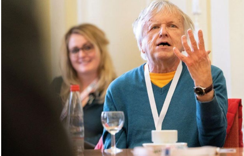
Willi Jakob von Einfach Heidelberg e. V. berichtet von den digitalen Projekten auf dem inklusiven Nachrichtenportal www.einfach-heidelberg.de

freiheit ist die Grundlage für die umfassende Information und Teilhabe aller Bürger*innen – egal ob mit oder ohne Behinderungen. Für öffentliche Stellen sind das Behindertengleichstellungsgesetz und die Barrierefreie-Informationstechnik-Verordnung (BITV 2.0) mittlerweile eindeutig: Sie sind verpflichtet, ihre digitalen Angebote barrierefrei zu gestalten.